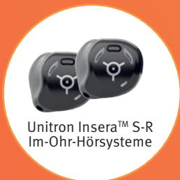
Unitron Insera™ S-R Im-Ohr-Hörsysteme